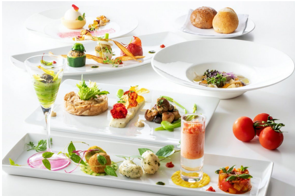
(画像挿入：ヨコハマ グランド インターコンチネンタルホテル オリエンタル ビーガンコース イメージ)

効果： 畜産を軽減し植物性食品の活用で温室効果ガス排出量や農耕地、水の使用量の削減に寄与、またインバウンド需要に伴う食の多様性につながる。「誰一人取り残さない」全てのゲストにとって心地良い空間・サービスに貢献。