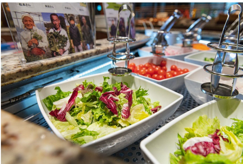
(画像挿入：横浜ベイシェラトンホテル&タワーズ)

効果：廃棄物の削減。生ごみのリサイクル率は約75%まで向上し、地産地消にも貢献。